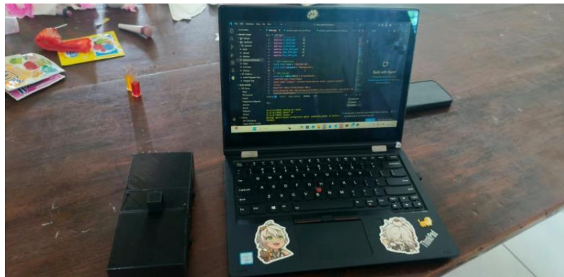
Gambar 2. Proses kerja alat Spectro-CAM untuk mendeteksi makanan yang mengandung zat berbahaya Rhodamin B